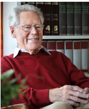
Theologe und Philosoph Hans Küng (Geb. 19. März 1928 in Sursee, † 6. April 2021 in Tübingen)

In Zusammenarbeit mit der Stiftung Weltethos Schweiz laden das Ökumenische Institut Luzern und das Institut für Sozialethik ISE der Theologischen Fakultät der Universität Luzern jährlich zu einer öffentlichen «Hans Küng-Weltethos Lecture» ein. Die Vorlesungsreihe diskutiert und entwickelt das von Hans Küng gegründete Projekt «Weltethos» sowie das Denken von Hans Küng weiter.