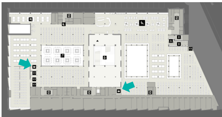
Kopier- / Druckräume in der Bibliothek ZHB Luzern im 1. OG