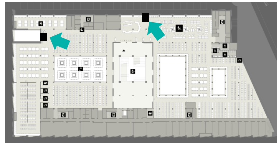
Standort Buchscanner in der Bibliothek ZHB Luzern im 1. OG