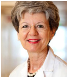
Dep. Gesundheitswissenschaften & Medizin

Professor of Marketing, Alberto I. Duran President's Distinguished Professor, University of Pennsylvania