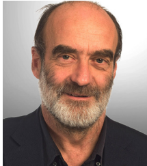
Kultur- und Sozialwissenschaftliche Fakultät

Professor of Children, Law and Religion (Theology and Religious Studies), University of Glasgow